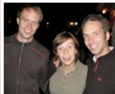
Titel: - Album: PAAADY 2006 von: Sven Hauberg