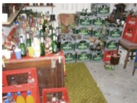
Titel: nachher... Album: Paady 2007