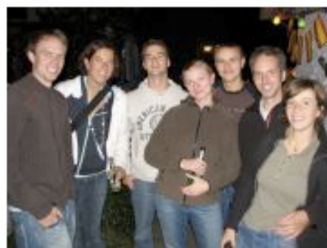
Titel: - Album: PAAADY 2006 von: Sven Hauberg