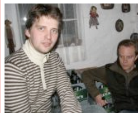
Titel: - Album: Paady 2007