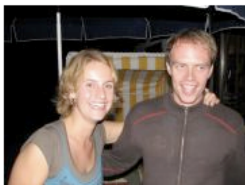
Titel: - Album: PAAADY 2006 von: Sven Hauberg