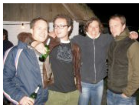
Titel: - Album: Paady 2007 von: Sven Hauberg